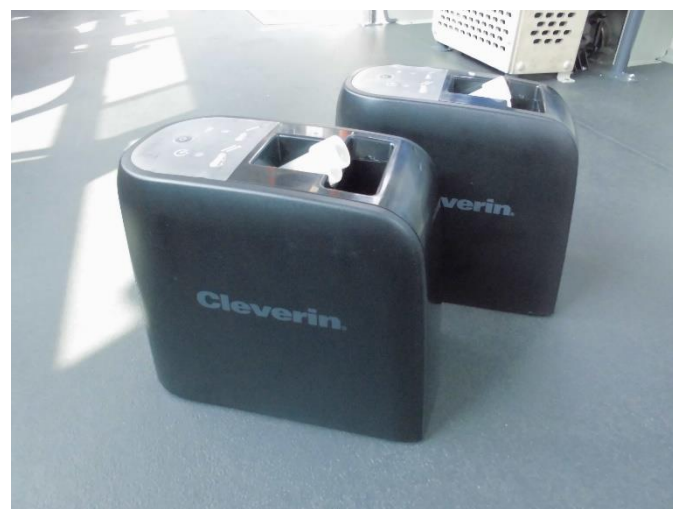
▲車両用クレベリン装置