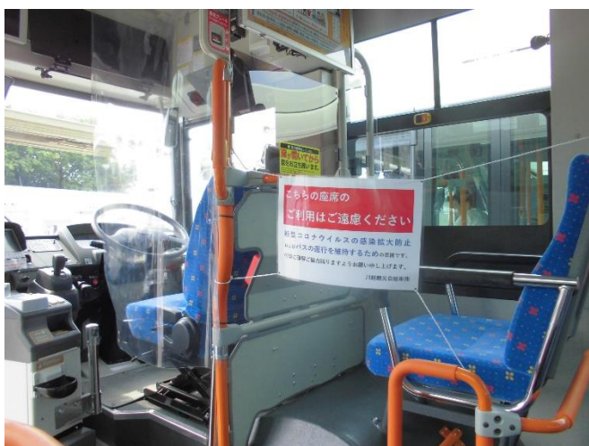
▲間隔をあけての着席依頼と運転席付近への 透明ビニールカーテンの設置