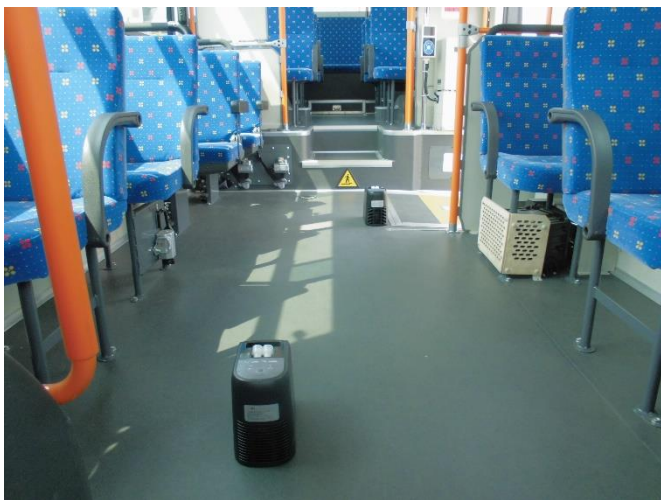
▲車両用クレベリン・作業の様子（路線バス）